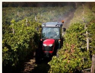
Le MF 3600

Il a été conçu pour prendre en charge différents travaux dans des espaces réduits ou confinés, avec sa faible largeur de 1 m.