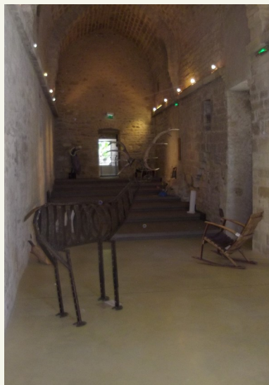
La classe de 2nde PV/VV