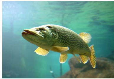
Un brochet !

La pêche aux carnassiers se pratique en lacs et en fleuves ; La famille des carnassiers est assez diversifiée et offre aux adeptes plusieurs façons de pêcher :