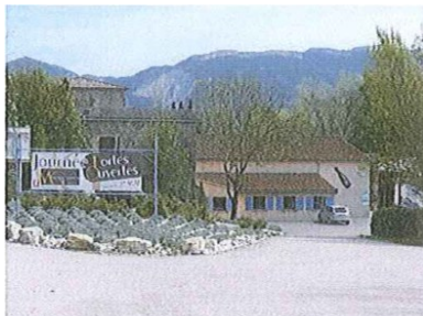
La cave Monge Granon

aussi visite guidée de la cave. Il y avait également une démonstration d'un artisan tonnelier, des balades en calèches et autres promenades en poneys. La journée se termina par un concours de remuage et un concert des « Flonflons Flingueurs ».