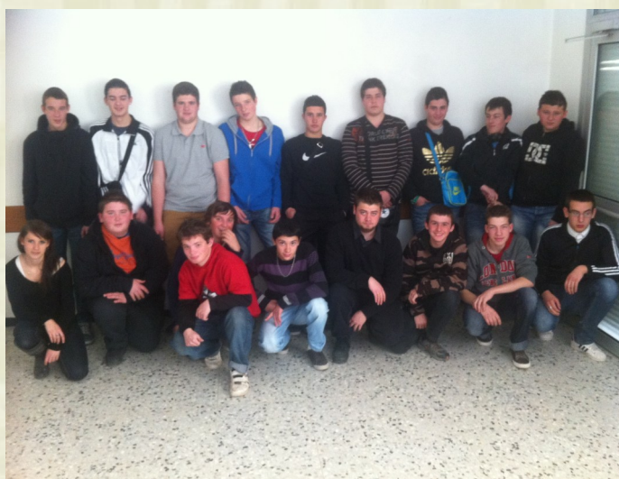
Les 2ndes PV/VV